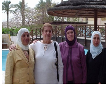
© الإحتفال بعيد الأم في أريحا

نلتقي معكم مرة أخرى لنطلعكم على آخر أخبارنا ونشاطاتنا الجديدة لنبقى على تواصل مع أفراد مجتمعنا الحبيب آمين أن تعود عليكم بالخير والفائدة