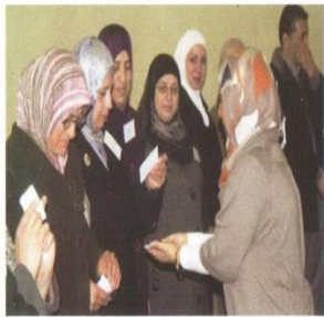
ورشة عمل حول مناصرة وتمكين النساء المصابات بالسرطان